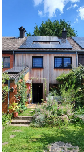
Energieverbrauch vor und nach der Modernisierung