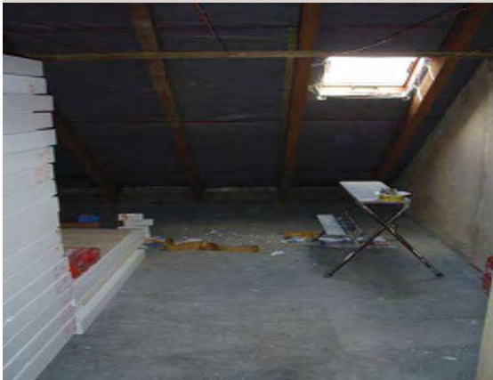
Während der Arbeit